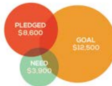
Lorem ipsum dolor sit amet unum consect etuer adipiscing elit sed diam nonummy nibh euismod tincidunt ut laoreet dolore.

Eodem modo typi qui nunc nobis videntur parum clari, fiant sollemnes in futurum lorem ipsum dolor sit amet, consectetur adipiscing elit erat euismod erat tincidunt ut laoreet dolore vel illum dolore eu feugiat.