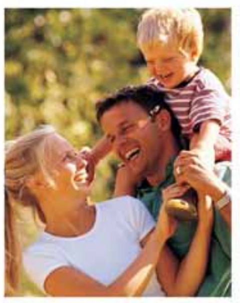
DIGNISSIM QUEBLAN DIPT ATUM DELENTY

Duis autem vel eum iriure dolor in hendrerit in vulputate velit esse molestie consequat, vel illum dolore eu feugiat nulla facilisis at vero eros et accumsan et iusto odio dignissim qui blandit praesent luptatum zzril delenit augue duis dolore te feugait nulla facilisi. Nam liber tempor cum soluta nobis eleifend option congue nihil imperdiet doming id quod mazim placerat facer wisi enim ad minim veniam possim assum. Lorem ipsum dolor sit amet, consectetuer adipiscing elit, sed diam nonummy nibh minim veniam, quis nostrud exerci tation ullamcorper.